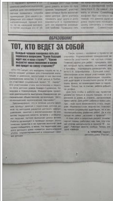
Педагоги Анжеро-Судженска рассказывают о проекте в своей городской газете Педагоги Анжеро-Судженска рассказывают о проекте в городской газете